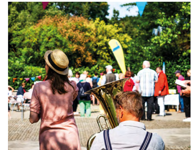
Tag des offenen Quartiers im Mueßer Holz 2021

Ein wichtiger Bestandteil der Städtebauförderung ist von Beginn an die Beteiligung von Bürgerinnen und Bürgern – mittlerweile eine Fördervoraussetzung aller Programme. Über die Jahre hat sich gezeigt, wie wichtig es ist, die Menschen in den Städten und Gemeinden frühzeitig einzubinden. Denn Bürgerinnen und Bürger sind Fachleute in eigener Sache: Sie kennen ihr Quartier, wissen, was fehlt und was verbessert werden kann – konkret und vor Ort.