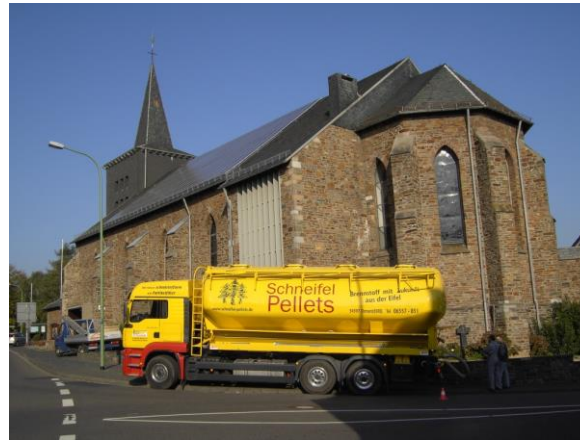
Hubertus-Kirche mit Solardach und Holzpellets-Lieferwagen