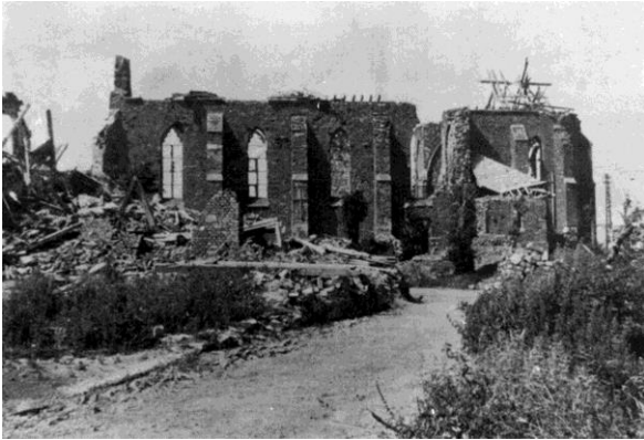
Kriegszerstörte Hubertus-Kirche im Jahre 1945