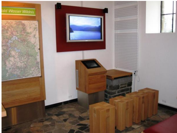
Filmmodul im Infopunkt Schmidt des Nationalparks Eifel