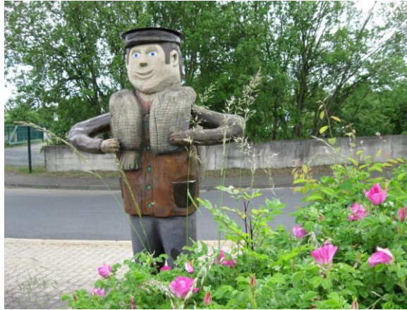
Schmuggler-Holzfigur im Ortsteil Harscheidt